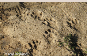
Empreintes de Louvre